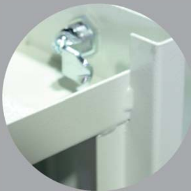
Geschweißtes Gestell Auszug t=2,5\text{mm} Einlegeboden t=2,0\text{mm} Gehäuse t=1,5\text{mm}

Einlegeböden für weitere Werkzeugsysteme sind möglich. Durch die identische Größen kann ein Werkzeugschrank für mehrere Werkzeugsysteme genutzt werden.