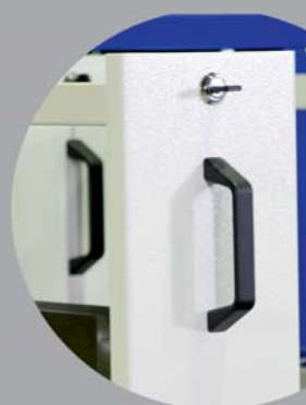
Abschließbarer Vertikalauszug Breite: 180mm