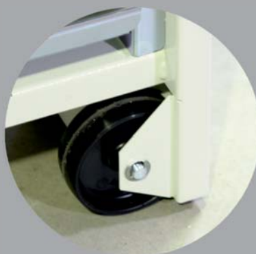
Stabile Laufrolle \varnothing 100\text{mm}